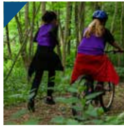
Run & bike