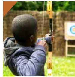
Tir à l'arc / Archerie