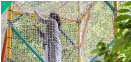
Cage à grimper